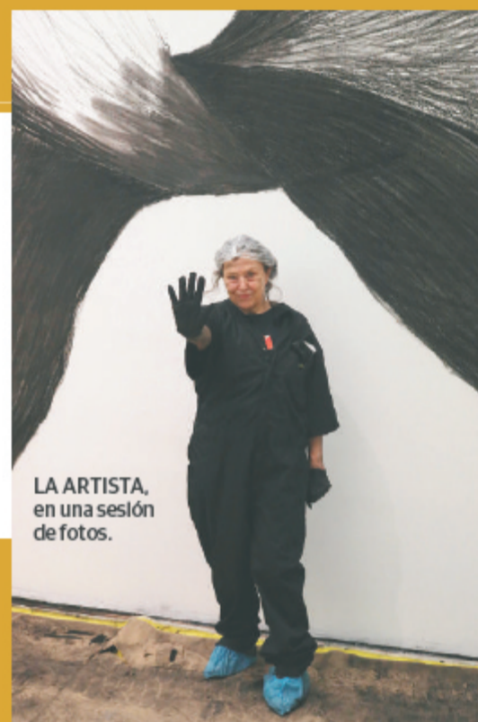
LA ARTISTA, en una sesión de fotos.

un territorio, mucha relación con el paisaje, la naturaleza. En la última parte está la idea del paisaje, un paisaje interior, me interesan mucho siempre las emociones, en estos últimos años hemos estado enfrentándonos a nuestras creencias, cuestionándolas de maneras importantes, eso está presente en todo el trabajo", detalló.